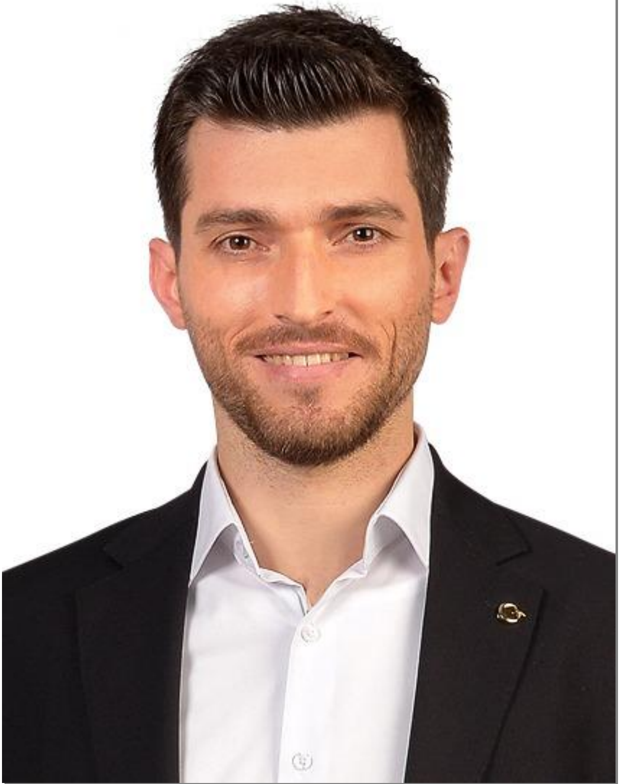
Ertuğrul KARAGÖL Belediye Başkanı